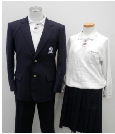
神戸モデルのブレザー 神戸モデルのスラックス・スカート 従来のポロシャツ