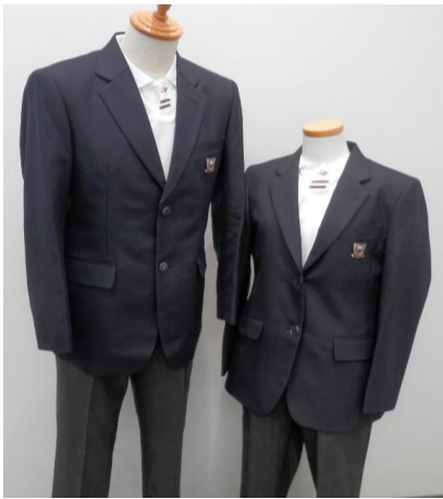
従来のブレザー 従来のスラックス・スカート 従来のポロシャツ

兵庫中学校では、以下のような着用が考えられます。ご参考にしてもらえればと思います。ご不明な点がありましたら、兵庫中学校(577-0744)へお問い合わせください。