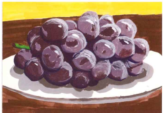
第24回『農』絵画コンクール県知事賞(風景画の部) 「大すきなぶどう」

『農』絵画コンクールは、自然とのふれあいを通じて、 農業の大切さを実感してもらうことを目的としています。