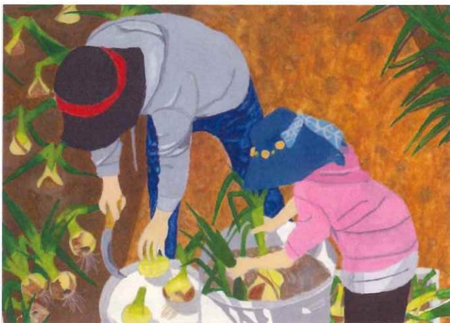
第24回『農』絵画コンクール県知事賞(人物画の部) 「たくさんとれたね！お手つだい」

農業保険制度は、農業が自然災害や獣害などによって受ける損失を補てんします。NOSAI ひょうごが実施している農業共済と収入保険は農家の経営を守ることで、国民の食料生産の確保に貢献しています。