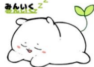
神戸市「みんなく」ロゴマーク “みんな”

「今日、健康委員会のアンケートの結果発表あったやんかあ。」 「ああ、オレ寝不足やった。でもそんなに早く寝られへんやんかあ。」 2人の児童の会話から始まる劇に全校生が見入っていました。