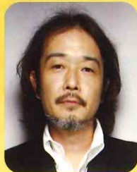
リリー・フランキー イラストレーター 作家・俳優など