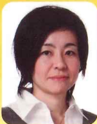
さい しょう げつ ノンフィクション ライター