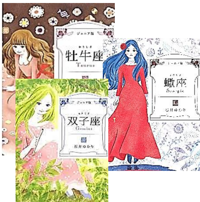
「ジュニア版 〇〇座(十二星座)」