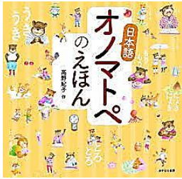
「オノマトペのえほん」 高野紀子 あすなろ書房

【わらうオノマトペ】にこにこ、げらげら、けけけ、あはは 【歩くオノマトペ】ずんずん、うろちよろ、よちよち、かっかっ 【おいしいオノマトペ】しゅわしゅわ、さくさく、ぽりぽり、ほくほく …たのしいオノマトペがたくさん！ほんをよんで、かんどしたら、 「めめめ」？「しくしく」？「ほろり」？「ぎゃあぎゃあ」？