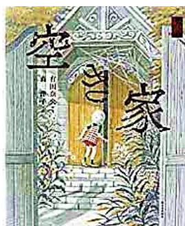
怪談えほん『空き家』 有田奈央 新日本出版社