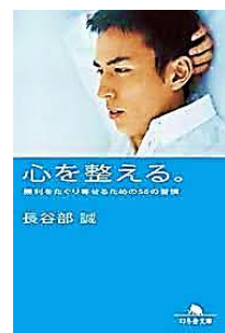
「心を整える。～勝利をたぐり寄せるための56の習慣～」 長谷部誠 幻冬舎