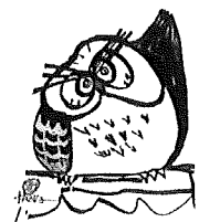
湊川高等学校キャラクター みなふく(卒業生作)