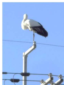
神出小学校にやってきた コウノトリ(11/29)

ことができるように学校でも指導していきます。来週の懇談会、短い時間ではありますが、お子様の成長や課題を共有できればと思います。ご多用とは存じますが、ご来校をお待ちしております。先日、運動場南側の電柱にやってきたコウノトリ（＝幸せを運ぶ鳥）が運んできてくれた幸せが、神出の町にも満ち溢れる年の瀬でありますように…。