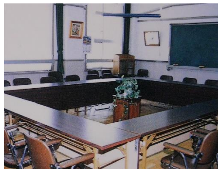
50 周年記念事業 正門・給食室・会議室 改修

若宮小学校の 50 周年ということで、いろいろな所を改修工事してもらいました。2号線沿いの南側の入口には、立派な正門ができました。新校舎になったことで、現在はありませんが、この時の学校名を刻んだ石が、現在は若宮公園の入口に立派な石碑の一部として置かれています。