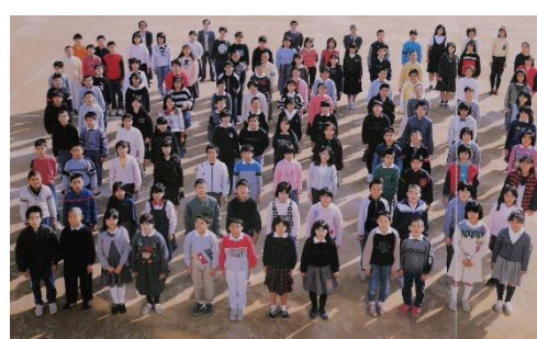
第49回卒業生集合写真